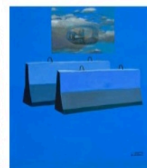
Eman Ali, Banat Al Fi'qa (Les Filles d'Argent) , 2022, impression d'art à l'aide de pigments d'archives sur papier Hahnemühle Pearl, 20 x 20 cm. Édition de 5 + 2 EA. Hunna Art, Dubai (EAU).