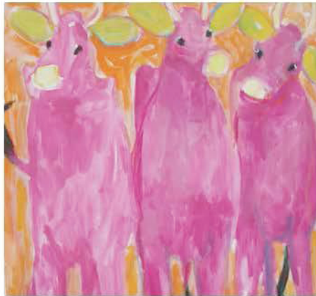
Les vaches roses (2015) Zuka