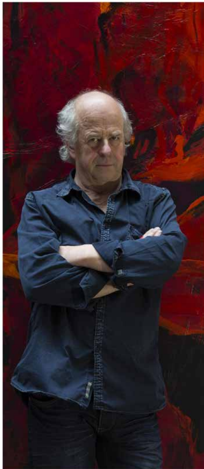
Charles Belle : « Certains ne voient dans mes images que des olignons, des arbres, des fleurs... Alors que je ne fais que parler de mystère, de vertige et de profondeur. »

» « sources », de Charles Belle, éd. sources, 524 p. 120€, en librairie et sur le site www.charlesbelle.com .